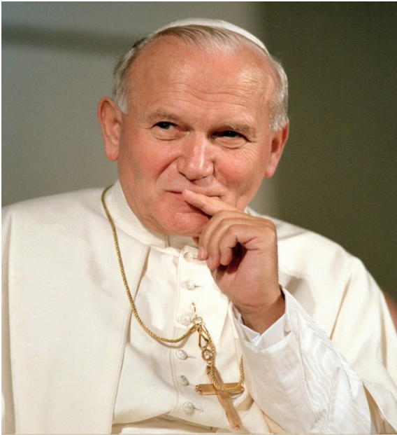
Bienheureux Jean-Paul II